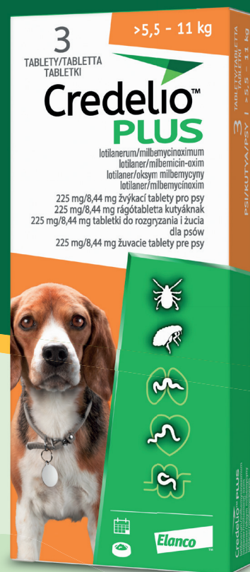
Сликите од производот се симболични